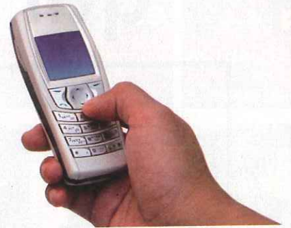
Téléphoner via son mobile coûtera-t-il bientôt moins cher ?

Les opérateurs mobiles outre-mer n'auront pas le choix. En 2010, ils devront baisser les tarifs qu'ils se facturent entre eux pour acheminer leurs appels, tarifs dits de gros. C'est l'Autorité de régulation des télécoms (Arcep) qui leur impose de diminuer leurs prix – de 37% pour Orange Caraïbe, de 30% à 47% pour les autres opérateurs. Le but est que les opérateurs fassent bénéficier de ce gain financier non négligeable à leurs clients, en leur proposant des tarifs moindres, même si rien ne les y oblige. La décision de l'Arcep a été annoncée le 29 juillet, soit quelques jours après celle de l'Autorité de la concurrence qui a infligé une sanction de 27,6 millions d'euros à France Télécom pour "avoir entravé abusivement le développement de nouveaux opérateurs concurrents dans les Dom" entre 2001 et 2006. ■